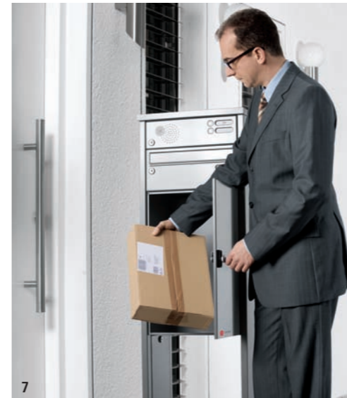
7 Und entnehmen Ihr Paket. Der nächste Zusteller kann kommen.