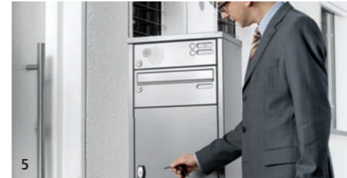
5 Sie kommen nach Hause und sehen die verschlossene Renz-Depotbox.