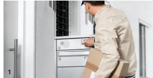
1 Der Paketzusteller kommt – aber Sie sind nicht zu Hause.

Die Renz-Depotbox funktioniert genial einfach.