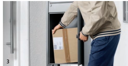
3 Er legt das Paket einfach in die Renz-Depotbox hinein.