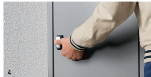
4 Er schließt die Tür, drückt den Drehgriff, und das Paket ist eingeschlossen.