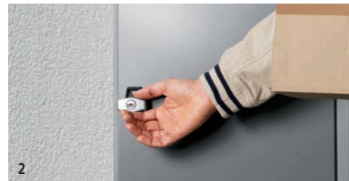
2 Der Zusteller kann die Tür ohne Schlüssel öffnen.