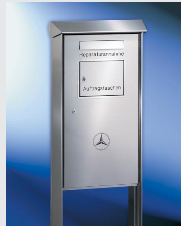
Autohauskasten 455 x 990 x 145 mm für freistehende Montage. Prisma-Verkleidungsgestell aus Edelstahl V4A. Integriertes Fach für die Entnahme von Auftragsstaschen.

Die neuen Autohauskästen bieten vielfältige Gestaltungsmöglichkeiten in Form und Farbe. Die Anforderungen von Versicherungsgesellschaften sowie Designvorgaben der Automobilhersteller und -Händler können somit erfüllt werden.