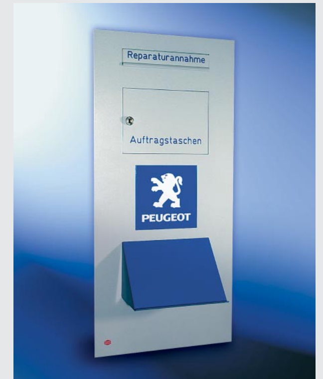
Durchwurf-Autohauskasten 370 x 880 x 145 mm, für Montage im Türseitenteil, Einwurf vorne, Entnahme hinten, mit Fach für die Entnahme von Auftragsstaschen und Schreibpult. Die sicherste Form der Aufbewahrung von gefüllten Auftragsstaschen im Hausinneren.